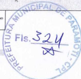
TABELA SEINFRA V026 1 (DESONERADA)PREFEITURA DE PARAMOTI

ULT ATUAL ABR/2019 (SEINFRA) E OUT/2018 (PREFEITURA)