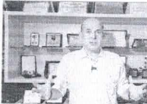
DISCURSO DE RC deu tom que será usado na campanha