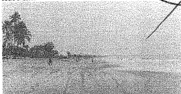
A TENDÊNCIA é de redução das chuvas a partir desta quinta-feira

As três maiores precipitações entre ontem e hoje foram nos municípios de Deputado Irapuan Pinheiro (62,5 mil, na região do Sertão Central e Inhambun); Massapê (58,2 mm), na região de Litoral Norte; e na cidade de Tururu (56mm), na