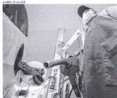
PREÇOS ficaram estáveis entre as duas últimas semanas no Ceará e no Brasil

Presidente afirmou que a queda deve seguir por semanas