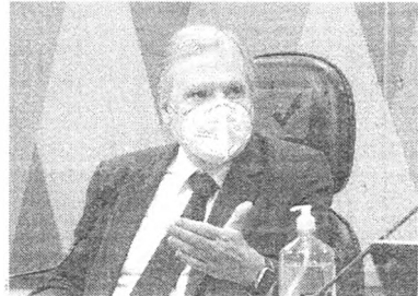
TASSO diz que mortes têm relação com atraso na compra de vacinas