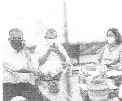
ANDRÉ Figueiredo, Sarto, Izolda Cela e Cid Gomes, na reunião do PDT

Além do PT, o senador Cid Gomes também elencou as paritidos aos quais o PDT espera se aliar, entre as dez maiores bancadas no Congresso Nacional. Ele enfatiza que espera manter o entendimento com o Progressistas, o PSD e o PSB. Sobre o novo União Brasil, agenciado a despeito da fusão entre PSB e DEM, a posição do MDB de Fúncio Oliveira, disse não haver veto e que o partido será procurado. Falou também da tentativa de atrair o Republicanos. “Na última eleição