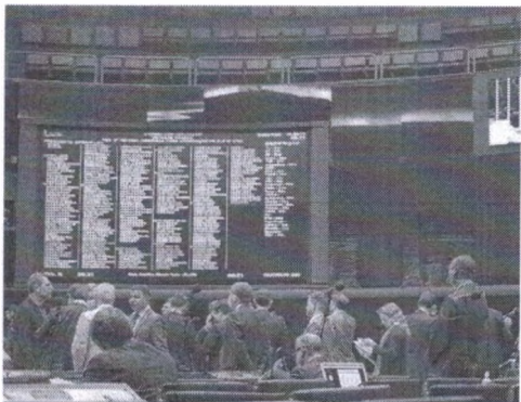
PROJETO que tramita na Câmara prevê mensalidade em universidade pública

constitucionalmente com base no artigo 206, que fixa a "gratuidade do ensino público em estabelecimentos oficiais".