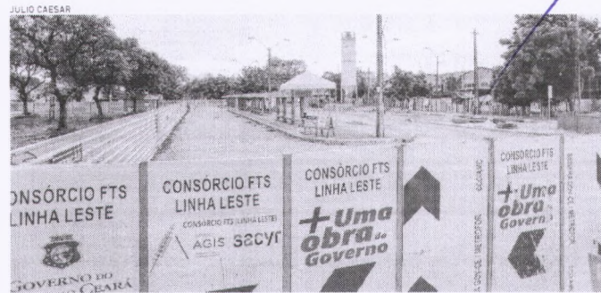
OBRAS da Linha Leste do Metrô de Fortaleza seguem em ritmo lento

| TRANSPORTE | Prazo inicial para entrega da obra seria em dezembro deste ano. Seinfra prevê agora entrega 2024