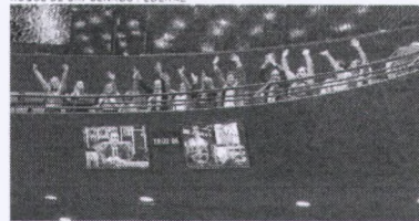
DA GALERIA O Plenário, profissionais comemoram aprovação do projeto