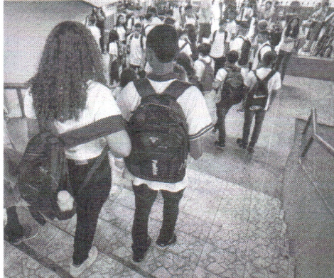
NA ESCOLA de Ensino Médio Dr. César Cais, o retorno dos alunos sera gradual