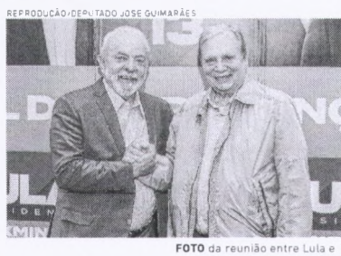
FOTO DA REUNIÃO ENTRE LULA E TASSO FOI DIVULGADA ONTEM