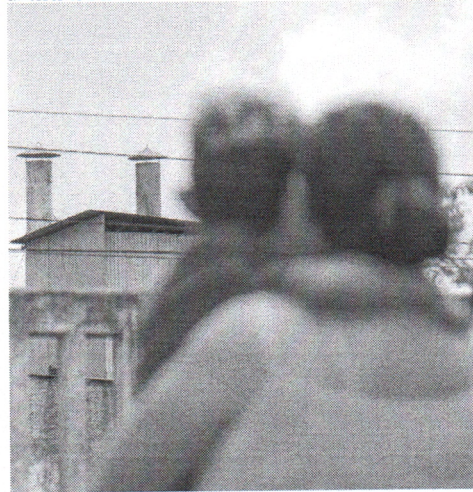
FÁBRICA Mar Reciclagem fica em Maracanaú

Fedor, incômodo, mau cheiro e ansia de vômito são sensações diárias relatadas pelos moradores do bairro Acaracuzinho, em Maracanaú (na Região Metropolitana de Fortaleza). O motivo do desconforto é a localização da fábrica de reciclagem de animais, MAR Reciclagem, no Distrito Industrial I, a menos de 100 metros de distância do bairro.