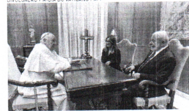
LULA e Janja trocaram presentes com Francisco

Em seu primeiro dia de agenda oficial em Roma, o presidente Luiz Inácio Lula da Silva (PT) se encontrou ontem com o papa Francisco a portas fechadas no Vaticano. Os dois conversaram sobre a situação política na América Latina, segundo comunicado emitido pela Santa Sé.