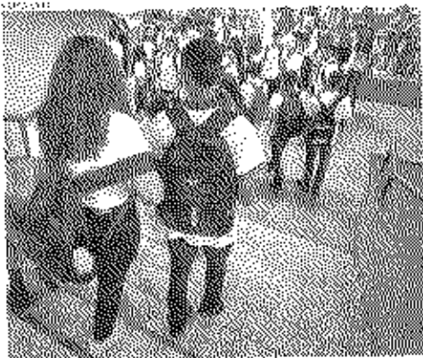
Na escola de Itabora, no interior do Ceará, a rede estadual retomou as aulas.

Com o início das aulas, as escolas do Estado retomam o ensino. No Ceará, o retorno dos estudantes às salas de aula ocorreu em 1987. O primeiro dia de aula foi em 19 de fevereiro, com o início das aulas em 20 de fevereiro. O primeiro dia de aula foi em 19 de fevereiro, com o início das aulas em 20 de fevereiro.