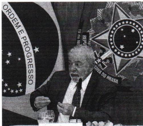
Lula remarcará viagem à China

segunda-feira, 27, mas a solenidade de posse aguardará a presença de Lula.