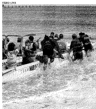
PROJETO usou canoa havaiana para passeio de pessoas com deficiência

GABRIEL DAMASCENO ESPECIAL PARA O POVO gabriel.damasco@opovo.com.br