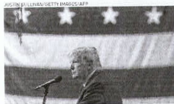
TRUMP recorreu da decisão na Suprema Corte dos EUA

A Suprema Corte do Colorado decidiu ontem, 19, uma decisão que barra o ex-presidente americano Donald Trump de aparecer na cédula de votação das primárias do Partido Republicano, neste Estado, no próximo ano. De acordo com o tribunal do Estado, Trump está "desqualificado" para concorrer à presidência dos Estados Unidos. A decisão de hoje reverte uma decisão anterior de um tribunal distrital de Denver que determinou que a cláusula de desqualificação da 1ª Emenda da Constituição, originalmente destinada a tratar de secessionistas após a Guerra Civil, não se aplicava ao ex-presidente. "A maioria do tribunal considerou que o presidente Trump está desqualificado para o cargo presidencial de acordo com a seção tres da décima Quarta Emenda da Constituição", diz a decisão. "Como ele está desqualificado, seria um ato ilícito, de acordo com o código eleitoral do Estado do Colorado, que ele aparecesse como candidato na cédula das primárias presidenciais". Na sua decisão, o tribunal afirmou que as ações de Trump antes e em 6 de janeiro de 2021 constituíram envolvimento em insurreção e que os tribunais tinham autoridade para aplicar a seção 3 da Emenda. "Não chegamos a essas conclusões levantadamente", diz a decisão do tribunal. "Estamos cientes da magnitude e do peso das