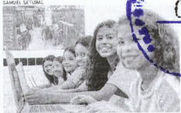
PROGRAMA busca levar conectividade para uso pedagógico nas escolas públicas

O prêmio da Mega Sena da Virada de 2023 já está em R$ 570 milhões, divulgou ontem, 19, a Caixa Econômica Federal, gerenciadora da loteria. A previsão era de que o prêmio chegasse a R$ 550 milhões, o que já seria um recorde. Como as apostas continuam abertas até às 17 horas do dia 31, o valor da premiação deve aumentar ainda mais. Até hoje, o maior prêmio pago em loterias no Brasil foi o da Mega Sena da Virada de 2022, R$ 541,9 milhões. Cinco apostas acertaram os seis números. A Mega da Virada deste ano será sorteadas às 20h do dia 31 de dezembro. A aposta mínima custa R$ 5 e presencialmente na lotérica ou R$ 30 se o jogo for feito pelo internet. (Agência Estado)