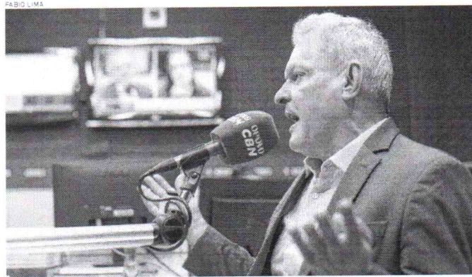
JOSÉ SARTO (PDT), prefeito de Fortaleza, durante entrevista na Rádio O Povo CBN

| FORTALEZA | Resposta faz, novamente, referência à música brasileira. Saúde e Educação não devem ter alterações