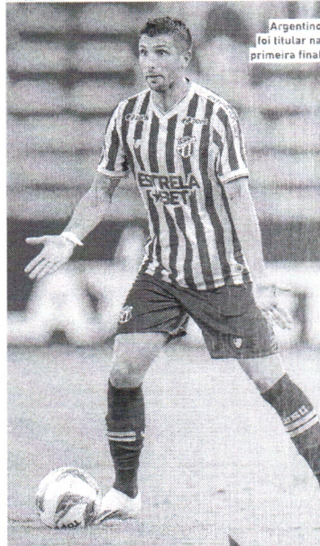
Argentino foi titular na primeira final