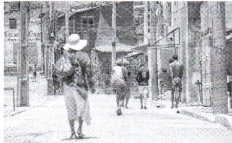
Eleição para os conselhos gestores das Zeis será realizada neste domingo, 22

A eleição para os conselhos gestores das Zonas Especiais de Interesse Social (Zeis) em Fortaleza será realizada neste domingo, 22. Moradores de 12 áreas prioritárias escolherão representantes para trabalhar, junto à gestão municipal, em benefício do desenvolvimento urbano dessas comunidades. A importância da participação nesse processo de escolha, contudo, ainda é desconhecida por muitos cidadãos.