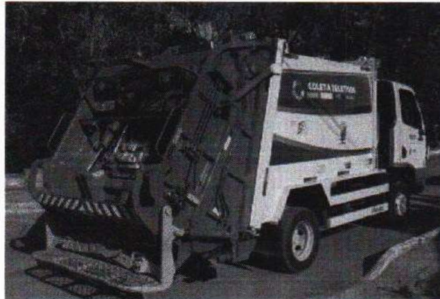
LIMPEZA URBANA E MANEJO DOS RESÍDUOS SÓLIDOS

PROJETO BÁSICO: MEMORIAL DESCRITIVO E DE CÁLCULOS, ESPECIFICAÇÕES TÉCNICAS, PLANEJAMENTO DOS SERVIÇOS E ORÇAMENTO.